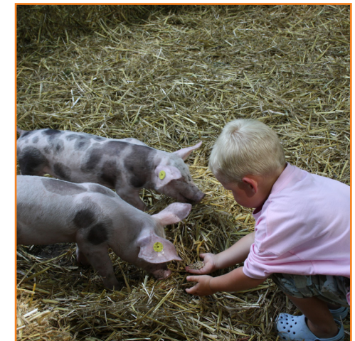
Varkensknuffelen bij familie van de Berkmortel in Sint Oedenrode